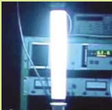
Kohlenstoff-Nanoröhrchen-Lampe erleuchtet die umgebenden Labor-einrichtungen.