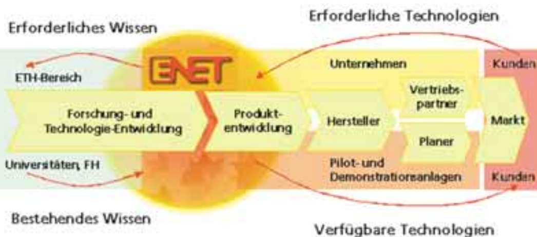
Bild 2 Technologie-Transfer kann nur erfolgreich sein, wenn er an der richtigen Stelle der gesamten Entwicklungskette positioniert wird.

Die vom ENET-Technologie-Transfer angewendete Methode wurde bereits bei der Entwicklung des Elektro-Fahrrads „Flyer“ verwendet. In einer ersten Phase ging es darum, die Machbarkeit der Ideen und Kon-